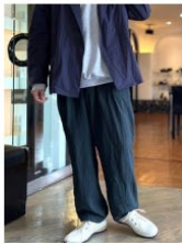
FUKA 靴のサイズ: 25.5cm マドラスオンラインショップ