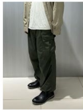
マサ 靴のサイズ: 27.0cm キャサリン ハムネット ロンドン シューズコレクション / ランパン コレクション 藤岡店