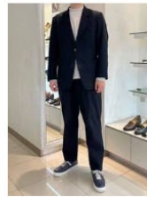
OT 靴のサイズ: 26.0cm マドラス 藤岡店