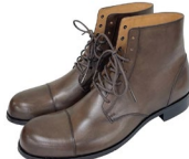
ルパン三世モデル